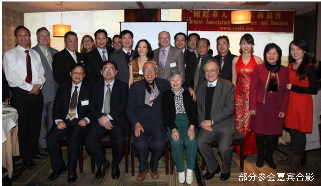
部分参会嘉宾合影

2月5日，龙门资本协助美国国际华人科技工商协会在曼哈顿中城御宴轩举办“2013中美商务新年交流晚宴”，美国工商科技各界人士逾百人出席了聚会。包括联合国前副秘书长冀朝铸大使及夫人、中国驻纽约总领馆科技参赞叶冬柏及庄嘉、郭晓林领事等嘉宾。